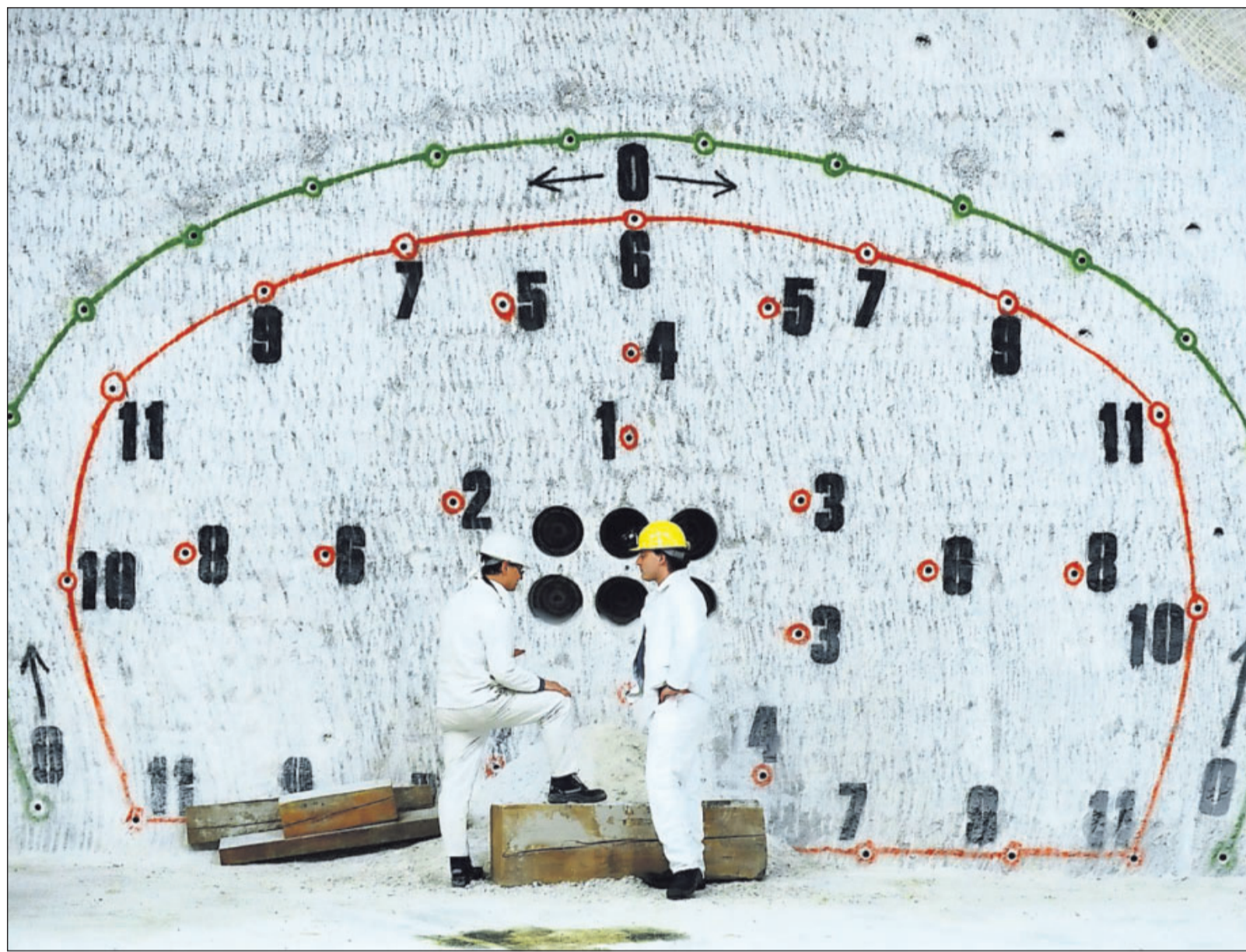
Vor der Explosion: Bergleute unterhalten sich im Erkundungsbergwerk Gorleben – in einer Tiefe von 840 Metern – vor dem Abbild eines Sprenglochbildes. Der Salzstock wird seit Jahren darauf hin untersucht, ob er sich als Endlager eignen könnte.

Nach den Erfahrungen, die man mit dem maroden Versuchs-Endlager in Asse gemacht hat, ist zudem ein neuer Begriff in die Diskussion eingeflossen: Rückholbarkeit. Soll der Atommüll unwiederbringlich gelagert werden – oder so, dass man ihn wieder herausholen kann? (blt)