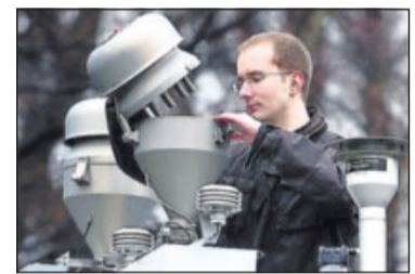
So wird gemessen: Feinstaubmessgerät in Dresden.

Die Feinstaub-Werte lagen demnach im vergangenen Jahr in Deutschland im Mittel sogar über dem Niveau der vorherigen vier Jahre. In Städten und Ballungsräumen lagen laut UBA 42 Prozent der verkehrsnahen Stationen über dem zulässigen Grenzwert.