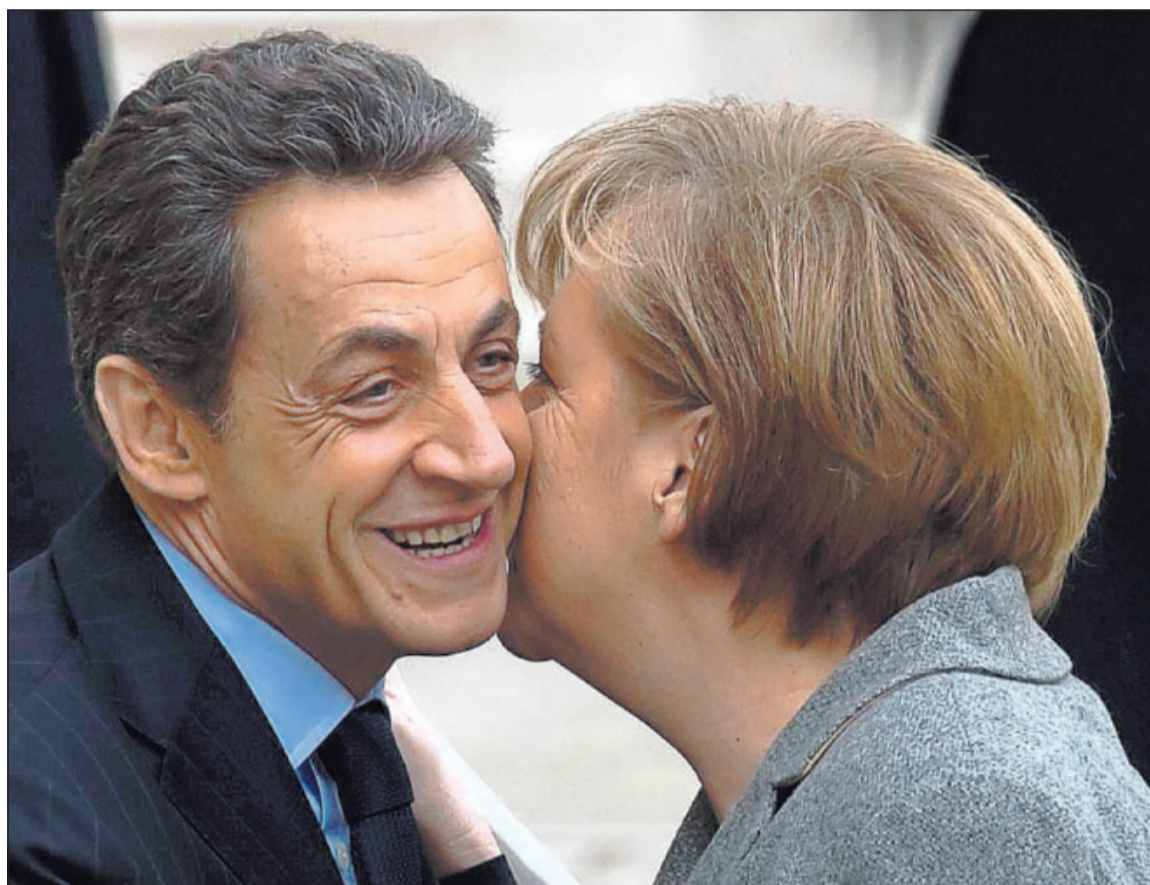
Einig in der Griechenland-Frage: der französische Präsident Nicolas Sarkozy und Bundeskanzlerin Angela Merkel in Paris beim 14. gemeinsamen Ministerrat ihrer Länder.

Der Fonds ist ein weiterer Beweis für das mangelnde Vertrauen, das die zahlungsfähigen Staaten in die Hellenen setzen. Merkel und Sarkozy erhöhten erneut den Druck, damit die Regierung und die Parteien in Athen endlich die zugesagten Spar- und Reformzusagen einhalten. Die abendliche Nachricht aus Athen, dass die Koalitionsregierung 15.000 Stellen im öffentli-