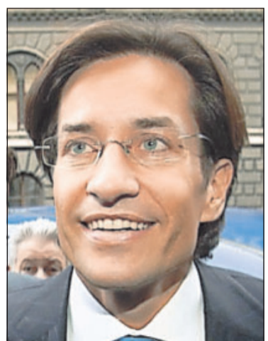
Reiste mit Diplomatenpass und einem Koffer voller Geld: Karl-Heinz Grasser.

Viele dieser Privilegierten können sich nur schwer vorstellen, künftig wie Normalsterbliche reisen zu müssen. So findet Altkanzler Franz Vranitzky (SPÖ), dass ihm auch als Pensionär ein Diplomatenpass zustehe. Es gibt weitaus brisantere Fälle. Wieder einmal steht Ex-Finanzminister Karl-Heinz Grasser, gegen den die Justiz in einer Reihe von Korruptionsskandalen ermit-