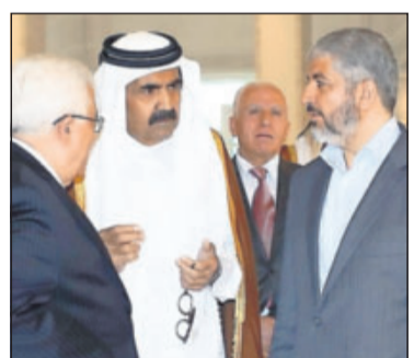
Katars Emir Bin Khalifa al-Thani (Mitte) mit Palästinenserpräsident Mahmud Abbas (links) und Hamasführer Chaled Meschaal.

Schon Ende April 2011 hatten sich Fatah und Hamas in Kairo auf eine gemeinsame Regierung und Neuwahlen am 4. Mai dieses Jahres geeinigt. Eine Einheitsregierung scheiterte aber bisher nicht zuletzt an Personalfragen. Die letzte Parlamentswahl der Palästinenser 2006 hatte die von der EU und den USA wie von Israel als Terrororganisation eingestufte Hamas gewonnen. Die „Erklärung von Doha“ nennt